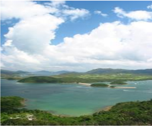
附圖三 【大網仔郊遊徑沿途風光】