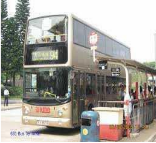
附圖一 【94 號西貢巴士總站】