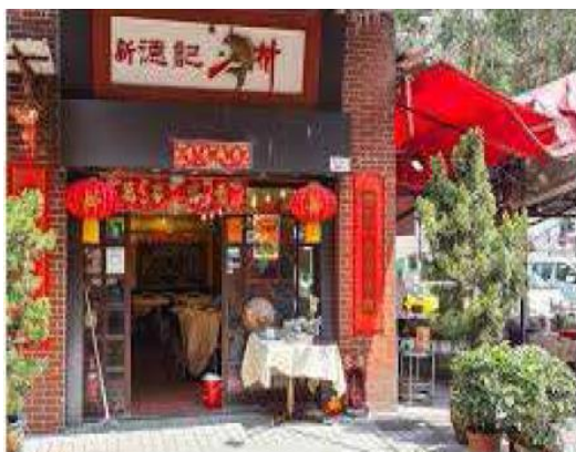
附圖五 新德記海鮮酒家